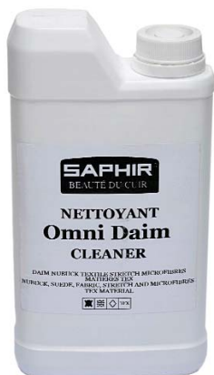
OMNI DAIM Арт. 0218, флакон 500 мл, бесцв.

Очиститель для глубокой и мягкой чистки изделий из всех видов замши, нубука, велюра, синтетических, текстильных и материалов «стретч». Возвращает первоначальный вид даже очень загрязненным изделиям, удаляет пятна и разводы. Освежает цвет.