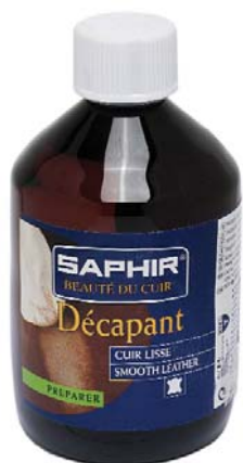
DECAPANT Арт. 0848, флакон 500 мл., бесцв.

Применение: Перед использованием взболтать, нанести средство губкой или мягкой тканью на обрабатываемую поверхность и протирать до исчезновения пятен, загрязнений. Через несколько минут поверхность приобретает свой цвет и мягкость.