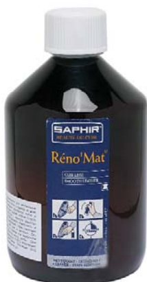
RENOMAT Арт. 0518, флакон 500 мл, бесцв.

Применение: Окунуть щетку в чистящий состав, потереть обрабатываемую поверхность, до образования пены, затем удалить пену с помощью промытой щетки или ткани. После высыхания замшу и нубук рекомендуется обработать спец. щеткой или губкой для придания бархатистости.