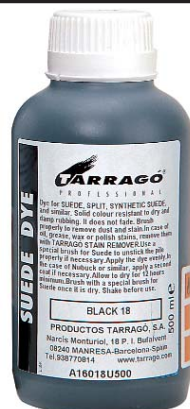
SUEDE DYE Арт. TPP16, флакон 500 мл. черный, т. коричневый, т. синий