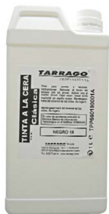
CLASSIC WAX INK Арт. TPP66, фляжка 1000мл, черный, т. коричневый